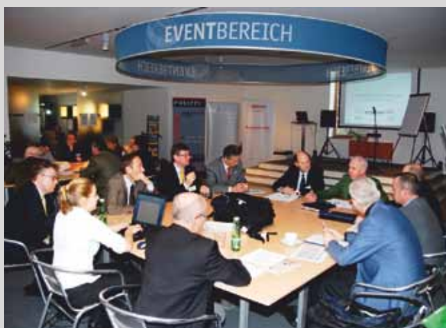
Место для проведения конференций: «День безопасности», проводимый федеральной землей Нижняя Австрия с участием около 50 слушателей