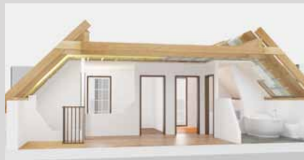
Модель для аутентичного представления внешней и внутренней реконструкции

Открытый в 2009 году «Мир Энергии» дополнит спектр предложений по теме энергетическая реконструкция, усовершенствование, а также строительство подвала. Таким образом, привлечется дополнительная группа посетителей из числа 897 000 тысячи австрийцев, планирующих реконструкцию дома в ближайшие 3 года. 3