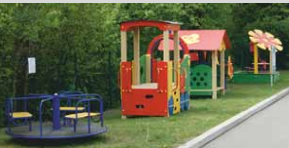
«Игровой Мир»: высококачественные игры для детей разных возрастных групп