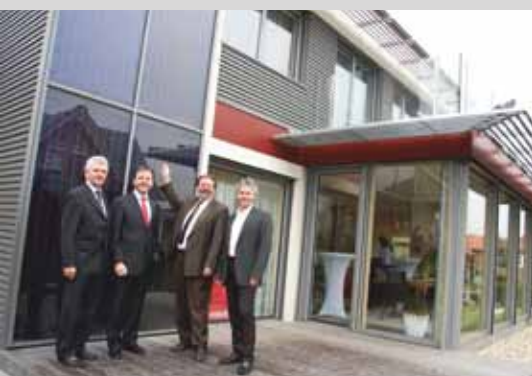
Интегрированная в фасад фотогальваническая установка: первый сборный дом с встроенной солнечной электростанцией можно осмотреть в «Голубой Лагуне»