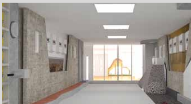
Требующий особого внимания – подвал: надлежащая изоляция, прокладка трубопровода и звукоизоляция являются решающими