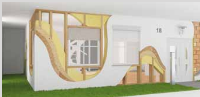
Модель «Реконструкция фасада» отображает элементы «правильного обновления» фасада: от изоляции до штукатурки, включая безупречный монтаж окна