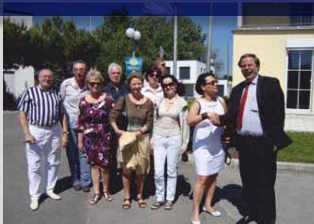
Делегация из Москвы в «Голубой Лагуне»: большой интерес вызвали архитектура и технология строительства

Благодаря авторитетности и роли уникальной платформы для всей отрасли, «Голубая Лагуна» сотрудничает с известными научно-исследовательскими институтами. В центре внимания находится непрерывное формирование сознания с сфере экологии, энергосбережения и обеспечения безопасности. «Голубая Лагуна» уделяет внимание таким актуальным темам, как накопление и сохранение солнечной энергии с целью самообеспечения энергией, а также проводит мероприятия по демонстрации высокого качества домов из сборных элементов, например тест Blower Door на определение воздухопроницаемости домов. Часто посещаемый выставочный центр «Голубая Лагуна» представляет собой, таким образом, идеальную платформу для технических нововведений и перспективных проектов при прямой связи с потребителем. Следующей особенностью «Голубой Лагуны» является её признание в качестве привлекательной площадки для проведения важных событий: многочисленных симпозиумов, пресс-конференций и конечно же мероприятий для посетителей, проводимых постоянно и с большим успехом.