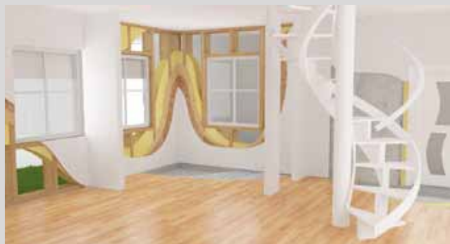
Модель, аутентично отображающая внутреннюю реконструкцию