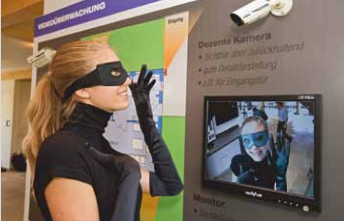
«Мир Безопасности»: всё о защите от взлома