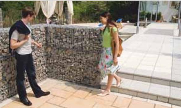
«Садовый Мир»: идеи оформления «зеленой гостиной»