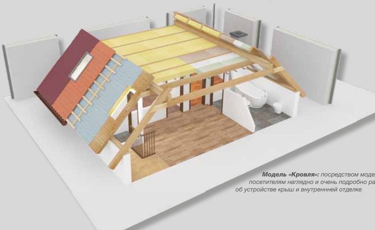
Модель «Кровля»: посредством модели посетителям наглядно и очень подробно разъясняется об устройстве крыш и внутренней отделке