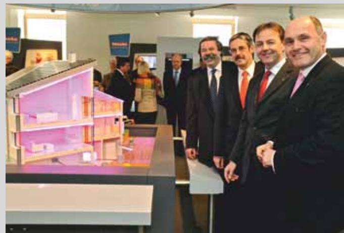
Открытие «Мира Энергии» в марте 2009 г.: директор Эрих Бенишек представляет Эрвину Хамеседер – генеральному директору Банка Райффайзен земель Нижняя Австрия-Вена, Ники Берлакович – федеральному министру экологии, лесного и сельского и водного хозяйства, Вольфгангу Сobotка – главе правительства земли Нижняя Австрия модель «Организм дома», отображающую технику в доме (слева направо)