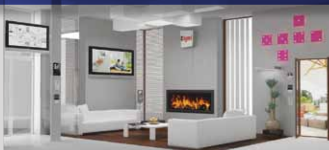
Сектор «Умное жильё» является частью выставки и представляет собой технические решения для максимального комфорта, экономичности, энергоэффективности, универсальности и безопасности

Тот, кто возьмет проект реконструкции в свои руки, найдет для себя ценную информацию, изделия, наглядные примеры в качестве поддержки при осуществлении проекта своими руками. Модели разреза крыши и фасада, демонстрация теплоизоляции, монтаж окна – все это можно будет «подсмотреть» и изучить в новом центре. На помощь мастеру-самоделкину придут также инфотерминалы и видео. Теме «Подвал» также будет уделено внимание: будут демонстрироваться различные системы строительства подвала. Высокие технологии для комфорта в быту будут эффектно показаны на выставке по теме «Умное жильё».