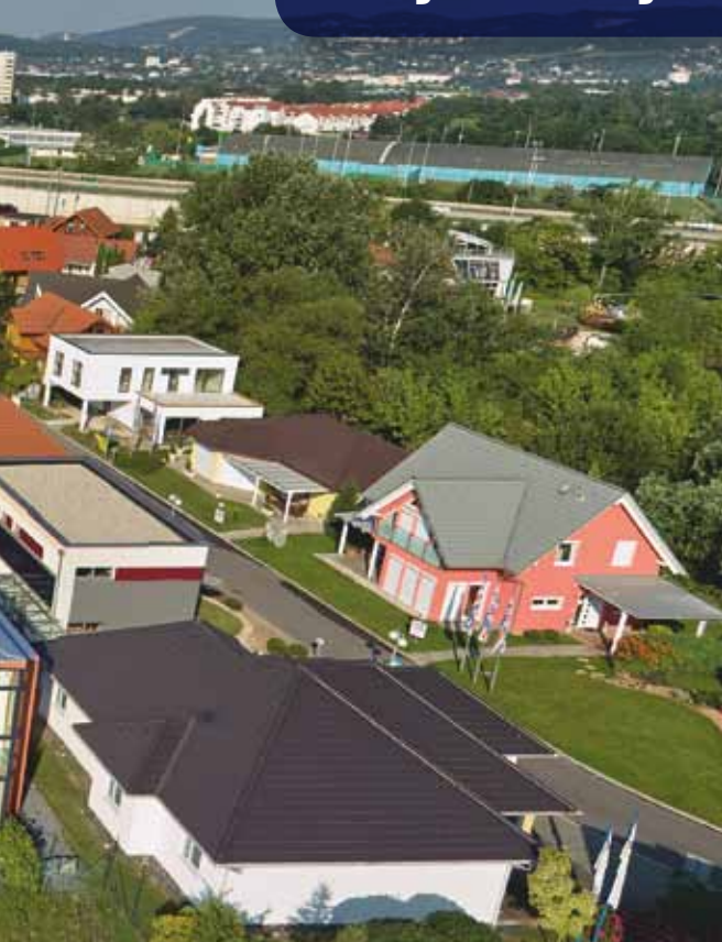
«Сборный подвал»: Консультирование и проектирование на месте