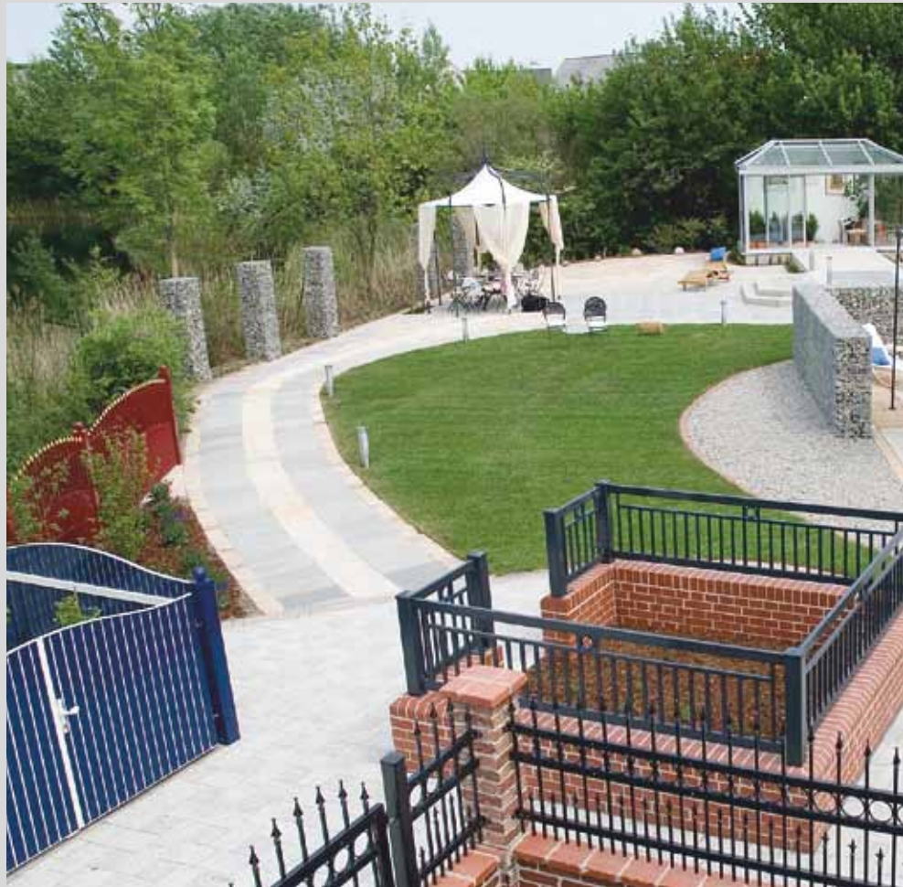
«Садовый Мир»: планирование дома и сада в гармоничном единстве