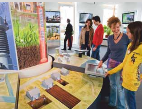
«Мир Энергии»: интерактивная передача знаний, например по теме «Энергетические ресурсы»

Все, что касается защиты от взломов и безопасности в собственных четырех стенах: с сентября 2010 года «Мир Безопасности» предлагает по этой важной теме индивидуальные консультации криминалистами-полицейскими, специализированные консультации по различным системам безопасности и оснащения, а также презентацию продукции, что помогают посетителям найти оптимальное решение для обеспечения безопасности собственного дома. Как быстро может произойти взлом было продемонстрировано вживую: чтобы взломать дверь на террасу профи понадобилось всего лишь несколько секунд.