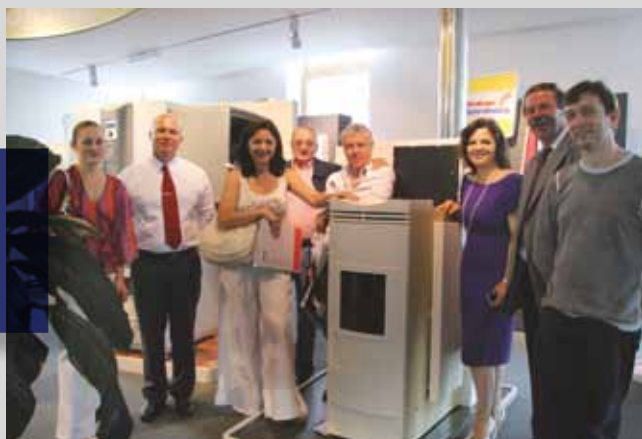
Представители российской области строительства восхищены «Миром Энергии»