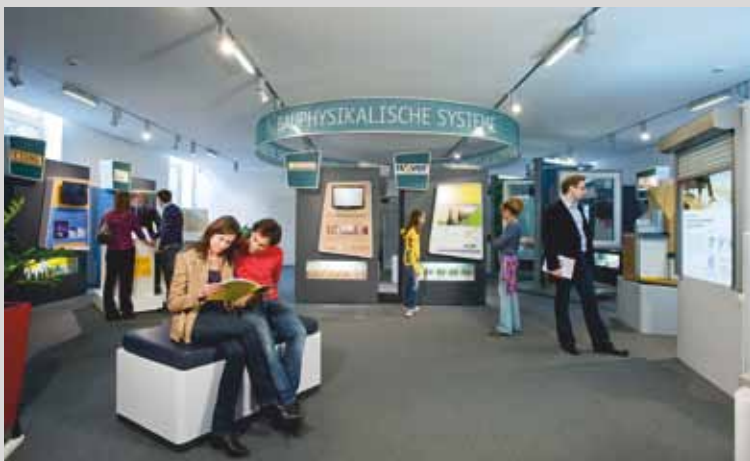
«Мир Энергии»: технология строительства – ключ к энергосбережению